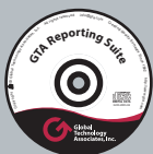
Reporting Suite 報表軟體